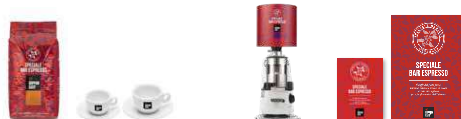
1Kg in Grani / Tazzine e tazze / Campana / Targa da esterno / Pannello decorativo 1Kg Coffee beans / Cups / Hopper / External sign / Decorative panel

Special Bar Espresso is a blend made of selected Arabica coffee and Robusta coffee. Full taste and medium in caffeine. Ideal for cappuccino, milky coffees, breakfast and long drinks.