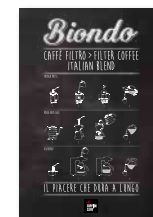
1/2 Kg in Grani / Take away / Pannello decorativo 1/2 Kg Coffee beans / Take away / Decorative panel