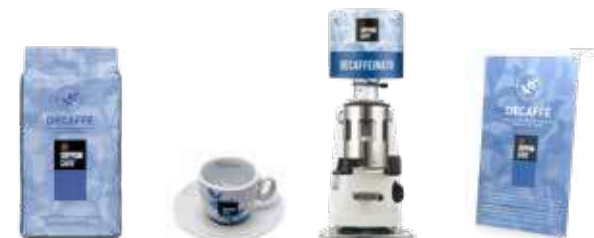
1Kg in Grani / Tazzine / Campana / Cartello da banco 1Kg Coffee beans / Cups / Hopper / Counter sign