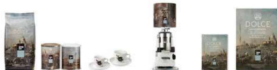
1Kg in Grani / 250g Lattina macinato e grani / Tazzine e tazze / Campana / Targa da esterno / Pannello decorativo 1Kg Coffee beans / 250g Tins ground and beans / Cups / Hopper / External sign / Decorative panel

From East to West through Venice. This blend, the first one made in Goppion, consists for a 90% of Arabica Coffees coming from Brazil, Guatemala and Ethiopia and for a 10% of Robusta coffees coming from Flores Island in Indonesia. The final result is a full body coffee with an intense, velvety flavor. The gentle acidity gives the perfect balance to the cup of coffee. It leaves a pleasant after-taste with fruits and cocoa scents followed by a flavor of milk chocolate and toasted bread.