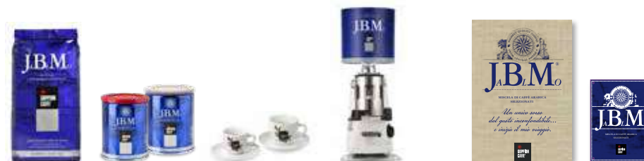
1Kg in Grani / 250g Lattina macinato e grani / Tazze e tazze / Campana / Targa da esterno / Pannello decorativo 1Kg Coffee beans / 250g Tins ground and beans / Cups / Hopper / External sign / Decorative panel

This blend is made of 100% of selected Arabica coffees coming from Central and Southern America. Vanilla, cocoa, almonds are the main flavors together with a nice scent of tobacco, typical feature of the coffee cultivated in the Blue Mountain, a region in Jamaica where the sunset is light blue tinted and where the best Arabica in the world comes from. The almost-sweet aromatic sourness of these beans gives to the JaBlMo blend an intense aroma of elegant finesse and a velvety taste.