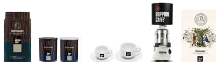
1Kg in Grani / 250g Lattina macinato e grani / Tazzine e tazze / Campana / Pannello decorativo 1Kg Coffee beans / 250g Tins ground and beans / Cups / Hopper / Decorative panel

They are like two brothers putting together their differences in an embrace of flavors. Aromas and scents are the typical ones of the velvety and soft Arabica and they are combined with a strong, aromatic and lightly spiced Indian Robusta flavor. Medium level of caffeine.